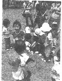
スイカ割りもした