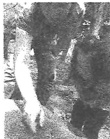
だんご虫見つけたよ

6月23日(木) 内みのわ運動公園に 35組の親子(おばあちゃんも)集まり ました。スタンパラリーやわらべ歌、?マン も登場し、初夏の一日を過ごしました。